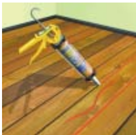
Šuvju un plaisu aizdarināšanai starp grīdas dēļiem