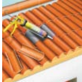
Kārniņu un kores nostiprināšanai izveidojot ūdensizturīgu, elastīgu, vibrācijas slāpējošu savienojumu