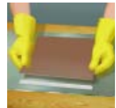
Līmes uzklāšana elastīgai līmēšanai punktveida vai stīgas formā. Atkarībā no virsmas gluduma pakāpes līmes šuvi saspiež līdz 1–3 mm biezumam