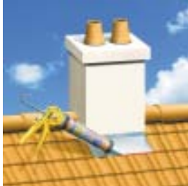
Ūdensnecaurīdīgu blīvējumu izveidošanai starp dažādiem jumtu materiāliem (izņemot bitumenu)