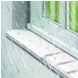
Palodzes skārda nostiprināšanai un blīvēšanai loga ailā