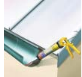
Lietus ūdens notekņu noblīvēšanai un savienošanai