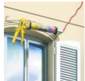
Fasādes plaisu elastīgai aizpildīšanai